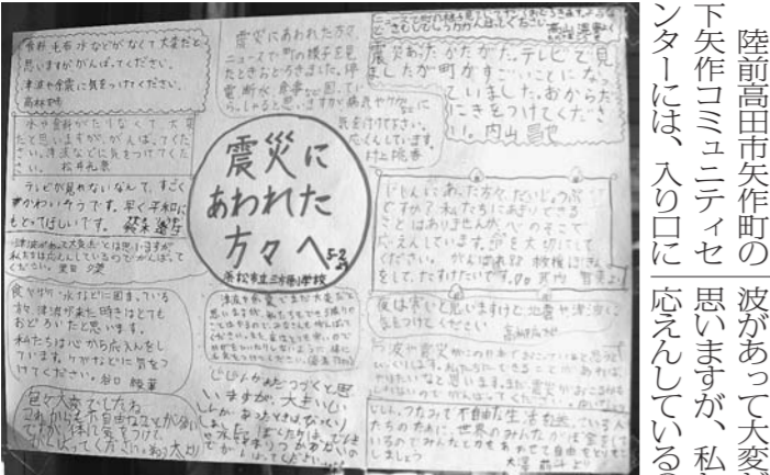
静岡県浜松市の小学生から寄せられた励ましのメッセージ

東日本大震災から10日余り、被災地には各地から物資や各種サービスが送られてきた。被災者や自衛隊員らに、被災地の現状や支援の状況について伝えるメッセージを送る。被災地には、被災者や自衛隊員らに、被災地の現状や支援の状況について伝えるメッセージを送る。 陸前高田市失作町の失作コミュニティセンターには、入り口に「被災地へメッセージ」のコーナーが設けられた。被災者や自衛隊員らに、被災地の現状や支援の状況について伝えるメッセージを送る。